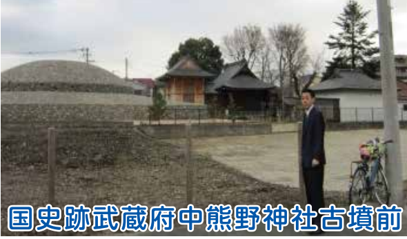
国史跡武蔵府中熊野神社古墳前