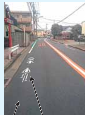
舗装改良・自転車ナビマーク設置