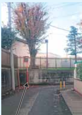
カーブミラー設置