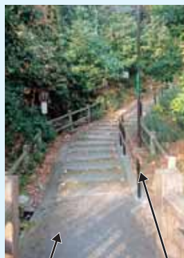
舗装改良・手摺設置