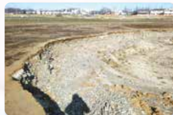
↑ 土砂が流されえぐられた地面

令和元年10月に上陸した台風19号の影響により、全国で多くの被害が出ました。府中市内においても、多摩川の増水によって市政初となる避難勧告が発令されました。府中市の対応を調査したところ、台風到来前後で市内37か所の避難所の開設を行い、合計8,280人の方々が避難されました。今回の経験を通して行政としては、新たな課題が出てきたと思います。市民の皆様も改めて日頃からの準備や備えが必要であると感じられたのではないのでしょうか。府中市では、自助・共助・公助の取り組みの推進を図り、災害に強いまちづくりを作るために引き続き調査・研究をしていきます。