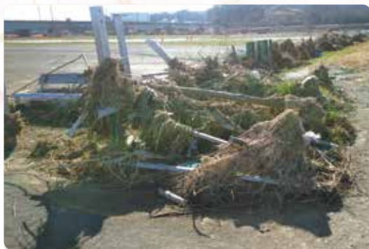
↑ 河川敷の被害状況