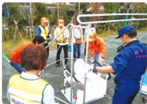
↑ 仮設トイレの組み立て体験

府中市では10月27日に市内3か所にて総合防災訓練が実施されました。10月12日の大型台風後の訓練であったため、多くの方々が参加していました。訓練現場では、「災害時にいかに落ち着いて行動することが大事か」を改めて感じさせて頂きました。当日は、避難場所設営や災害用仮設トイレ設置等、多くの体験や訓練が行われました。いざ災害が起きた時には、訓練の経験を活かして「冷静になる事」「市民同士の助け合いや連携を行っていく事」が重要だと考えます。