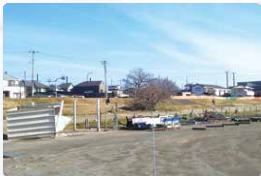
↑ 多摩川増水による設備の破損・倒壊・散乱