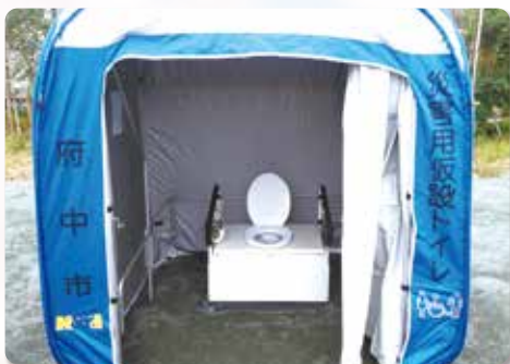
↑ 設置された災害用仮設トイレ