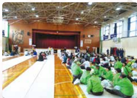
↑ 地域ごとに区切られた避難場所