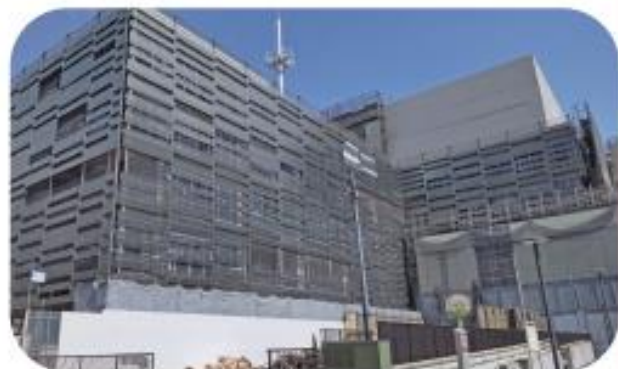
市庁舎【おもや】外観